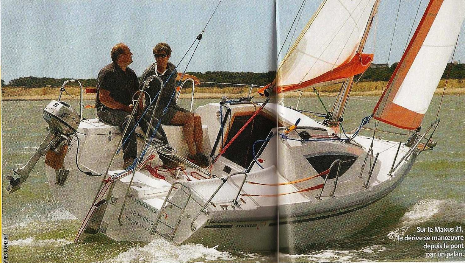
Sur le Maxus 21, la dérive se manoeuvre depuis le pont par un palan.