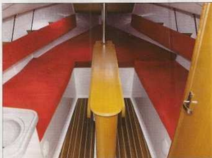
▲ Les vide-poches sont complétés par des coffres situés sous tous les matelas. Sur tribord, la porte donnant accès au cabinet de toilette.